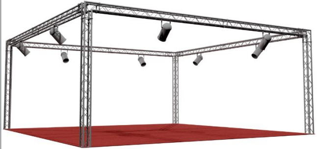
Immagine a puro titolo esemplificativo. Il modulo verrà adattato alle caratteristiche dell'area nuda prenotata per dimensioni e lati aperti.